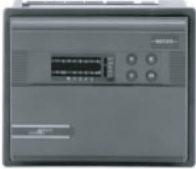
DX-9200 LONWORKS® 兼容 数字控制器